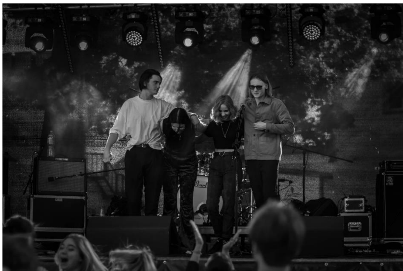
7 pav. „Menų festo‘21“ metu galimybę savo talentą pademonstruoti turi tiek vietiniai, tiek kviestiniai menininkai. Nuotraukoje – Tauragės jaunimo muzikos grupė „Neradau“.