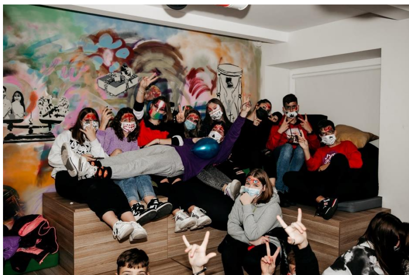
1 pav. Helovino vakarėlis Tauragės atvirame jaunimo centre.

AJC, kur vykdė informacinių renginių ciklą „Pažintis su TAJE“, kurio tikslas mokinius supažindinti su AJC veiklomis, savanorystės galimybėmis bei kviešti jaunimą tapti centro dalimi. Taip pat 2021 metais Tauragės jaunimo ir jaunimo organizacijų sąjunga „Tauragės apskritis stalas“ išsiuntė pirmąją tarptautinę savanorę, kuri atliks savanorystę Prancūzijoje. Per 2021 metus į atvirojo centro veiklas įsitraukė 1029 unikalūs dalyviai, o bendras lankytojų skaičius siekė 2494 asmenis. Per šiuos metus vykdytos 154 veiklos ir iniciatyvos.