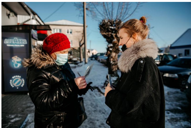
5 pav. akimirka iš Skaudvilės AJE kartu su Skaudvilės ugdymo ir vaiko gerovės centru ir VDC „Draugystės ratas“ organizuotos atviručių dalinimo akcijos.

3. Jaunimo savanorystė. Svarbiausia savanorystė vyko prisidedant prie COVID-19 vakcinacijos organizavimo. Jaunimo savanoriai ir jaunimo darbuotojai prisidėjo prie sklandaus vakcinacijos užtikrinimo Tauragės rajone. 2021 m. jaunimo savanoriškos tarnybos programą baigė ir 0,25 papildomo stojamojo balo gavo 23 jaunuolių.