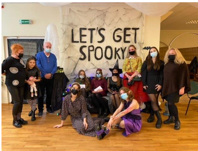
4 pav. Helovino vakarėlis Skaudvilės atviroje jaunimo erdvėje.

2. Skaudvilės AJE per 2021 metus organizavo 44 įvairias iniciatyvas, veiklas ir renginius. Bendradarbiauta su Skaudvilės gimnazija, Skaudvilės ugdymo ir vaiko gerovės centru ir vaikų dienos centru „Draugystės ratas“ kviečiant į bendras veiklas, pritaikant iniciatyvas pagal jų poreikius. Skaudvilės AJE 2021 metais prisidėjo prie miestelio šventės organizavimo, Skaudvilės kalėdinių eglučių miestelio įžiebimo, organizavo bendrus renginius su Skaudvilės kultūros namais, Skaudvilės biblioteka ir Tauragės AJC. 2021 m. kiekybiniai rodikliai: unikalių lankytojų – 178, bendras lankytojų skaičius – 864, organizuotos veiklos – 44.