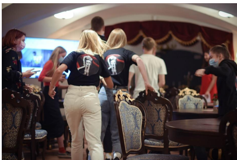
6 pav. akimirka iš „Menų festo‘21“ metu vykusių kūrybinių dirbtuvių.

4. „Menų festas‘21“ – jau ketvirtąjį kartą Tauragėje vykęs tokio tipo renginys, kurio metu Tauragės krašto jaunimas ir jaunieji menininkai iš kitų miestų turėjo progą pasidalinti savo meniniais sugebėjimais. Tris dienas vykusio festivalio metu buvo galima pamatyti dailininkų, fotografų parodas, sudalyvauti ar pasižiūrėti poezijos varžytuves „Slemas su ragais“, pasiklausyti vietinių atlikėjų ir populiarių kviestinių grupių koncertų.