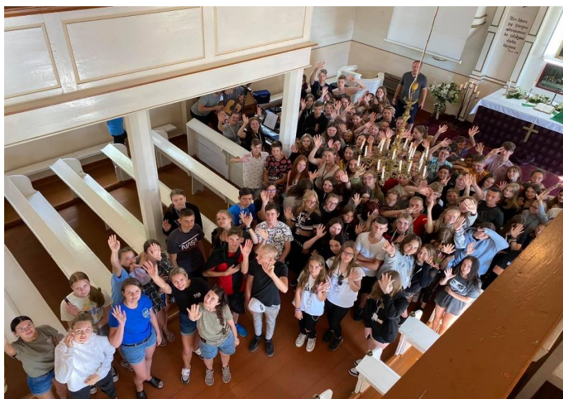
2 pav. Tauragės AJC ir Skaudvilės AJE darbuotojai vasarą savo veiklą pristatė jaunimo vasaros stovyklose.