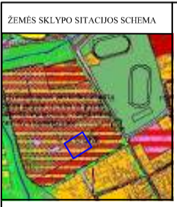
ŽEMĖS SKLYPO SITUACIJOS SCHEMA